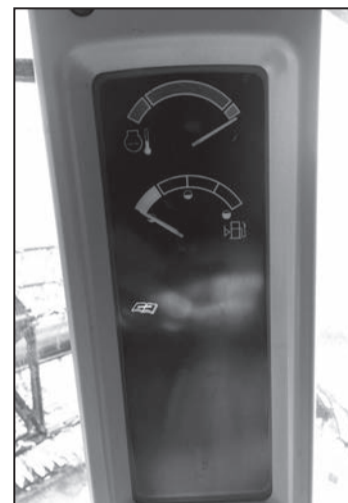
Блискавка влучила у найвразливіше місце - автоматику комбайна.

ВІД РЕДАКЦІЇ. Ми навели певні довідки про страхову компанію «Універсальна» і з'ясували цікаві речі. Згідно з Аналітичним дослідженням Міністерства аграрної політики та продовольства України за проектом «Розвиток фінансування аграрного сектору в Європі та центральній Азії (ІФС, Група світового банку)» страхова компанія «Універсальна» займає 8,3% ринку, сума зібраних премій більше 20,4 млн. грн., що становить 35,4%, від суми премій всіх компаній що брали участь у дослідженні. А от виплат у них – НУЛЬ! Чи не дивний збіг фактів?! Тож думайте, аграрії, з ким укладаєте угоди зі страхування врожайів та майна.